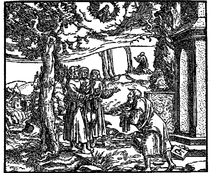
Los tres Angeles en los colores del arco iris

Un día, a la hora de mayor calor, Abrahán estaba sentado a la entrada de su tienda, a la sombra de un árbol. De repente vio, no lejos de él, tres hombres desconocidos que se acercaban. De inmediato fue a su encuentro, se inclinó profundamente y dijo al más distinguido de ellos: "¡Señor, si he hallado merced ante tus ojos, no pases de largo por mi tienda! Descansad un poco aquí debajo del árbol, —continuó diciendo, en tanto se dirigía a los tres—, voy a traer agua y a lavar vuestros pies. También quiero ofreceros pan para que recobréis fuerzas. Luego podréis seguir el viaje". Enseguida, entró corriendo a su tienda y dijo a Sara que preparara un pan de la harina más fina; él mismo tomó el mejor ternero y lo mandó a preparar de prisa. Entonces, sirvió mantequilla y leche y, después, el pan fresco y el ternero asado. Mientras comían, él permaneció de pie junto a ellos, debajo del árbol, para servirles. Acabada la comida, el más distinguido de los tres hombres le dijo al despedirse: "Dentro de un año regresaré. Para entonces, Sara ha de tener un hijo". Y Abrahán se dio cuenta que el mismo Dios, bajo la figura de un extranjero, con dos Angeles, había sido su huésped y se había dejado agasajar por él.