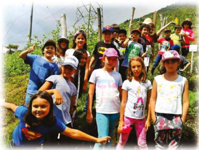
Abril 25 Grado tercero Cultivo San Antonio