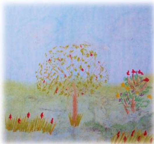
Melissa Bedoya Giraldo Grado séptimo

Porque más allá de tus manos, nunca ves el piso.