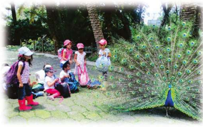
Abril 5 Zoológico Santa Fé Preescolar y grado primero