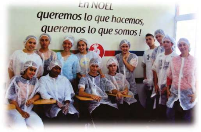
Mayo 3 y 4 Compañía de galletas Noel Grados 8°, 9° y 10°