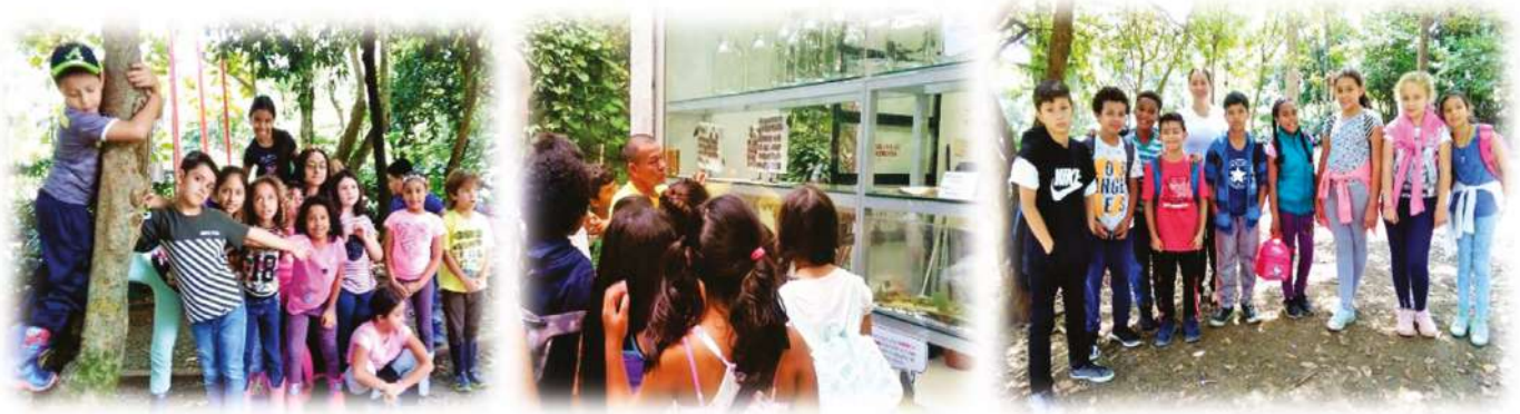
Abril 25 Grados segundo, cuarto y quinto Jardín Botánico