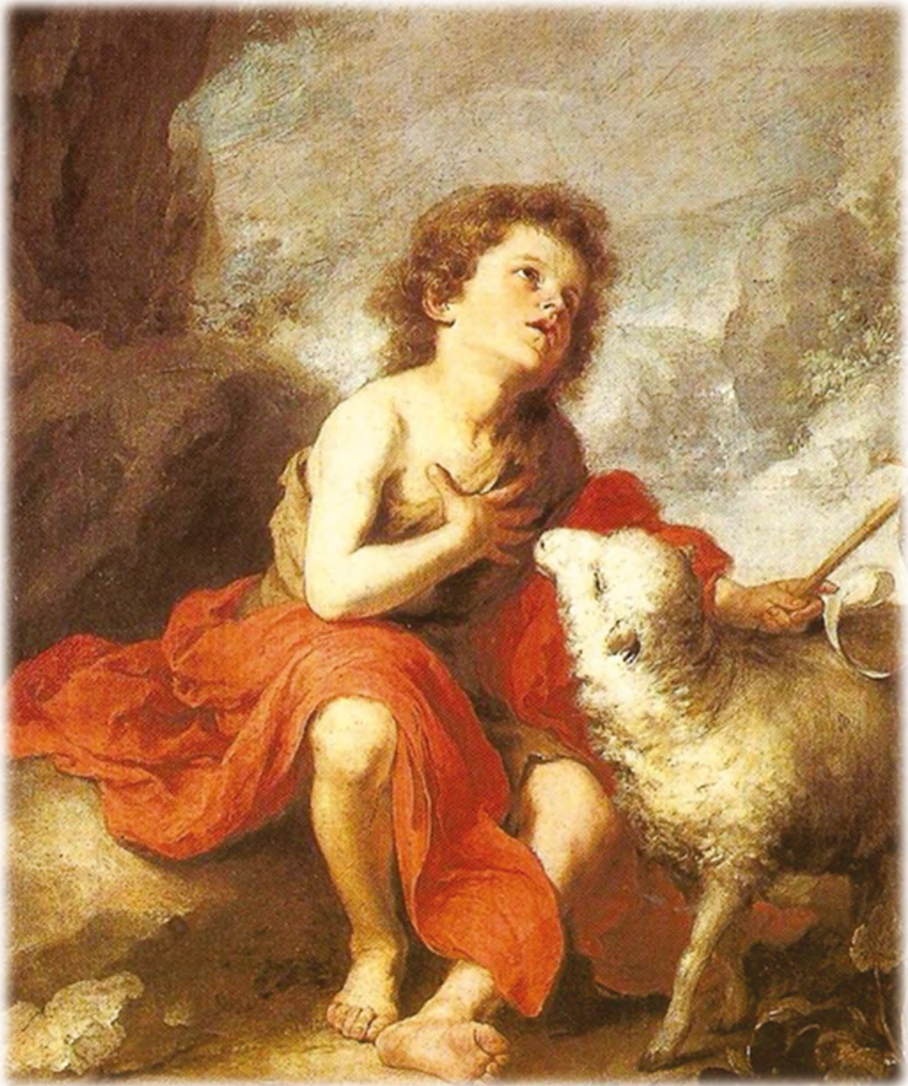
San Juan Bautista niño Bartolomé Esteban Murillo