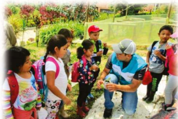
Mayo 5 Preescolar y grado primero Parque La Heliodora - Envigado